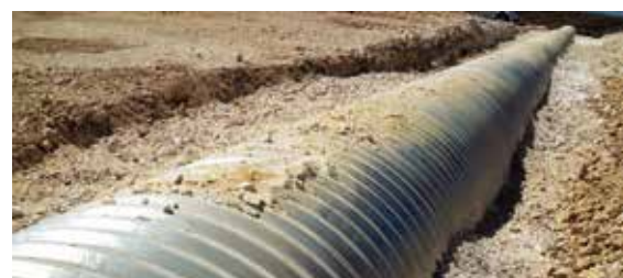
Кърджали – Маказа път E85 (I-5) Kardzhali - Makaza road E85 (I-5)