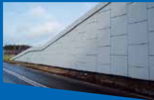
Подпорни стени ViaWall A Retaining wall system ViaWall A