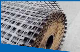
Геомрежи / Geogrids