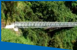
Временни и постоянни мостове Acrow Temporary and permanent Acrow bridges