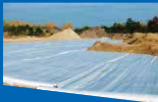
Тъкани и нетъкани геотекстили Woven and nonwoven geotextiles