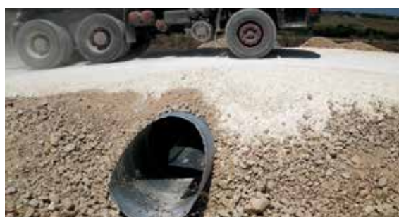
АМ "Марица" Лот 1 Highway "Marica" Lot 1