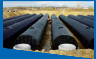
Резервоари WaterCorTank/WaterCorTank Retention tanks