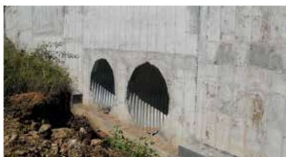
Обходен път на град Монтана I-1 (E79) км 108+790 Bypassing the city of Montana I-1 (E79) km 108+790