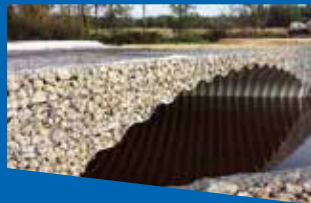
Подпорни стени ViaWall B Retaining wall system ViaWall B