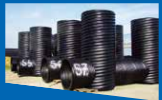
Шахти HelCor / HelCor wells