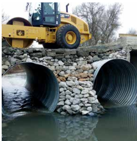
Временен водосток на р. Маринка Temporary culvert river Marinka