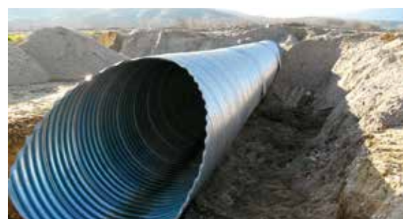
АМ "Струма" Лот 4 Highway "Struma" Lot 4