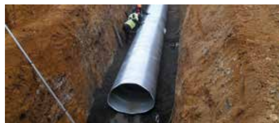
Златна мина гр. Кривопаланка Gold mine city Krivopalanika