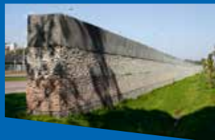
Габиони / Gabions