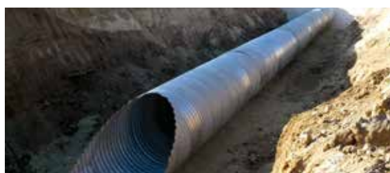
АМ E75 Сърбия Highway E75 Serbia