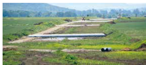
АМ "Тракия" Лот 4 Highway "Trakia" Lot 4