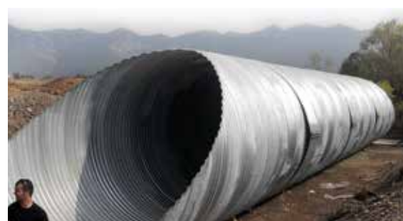
Обходен път на град Враца - Път I-1(E79) км 3+230 Bypassing of city of Vratsa - road I-1(E79) km 3+230